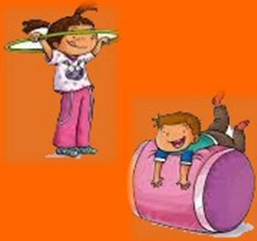
Angolo materiale psico-motorio