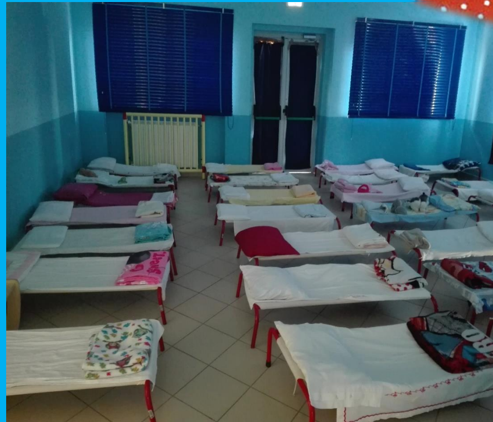
Aula del buon riposo