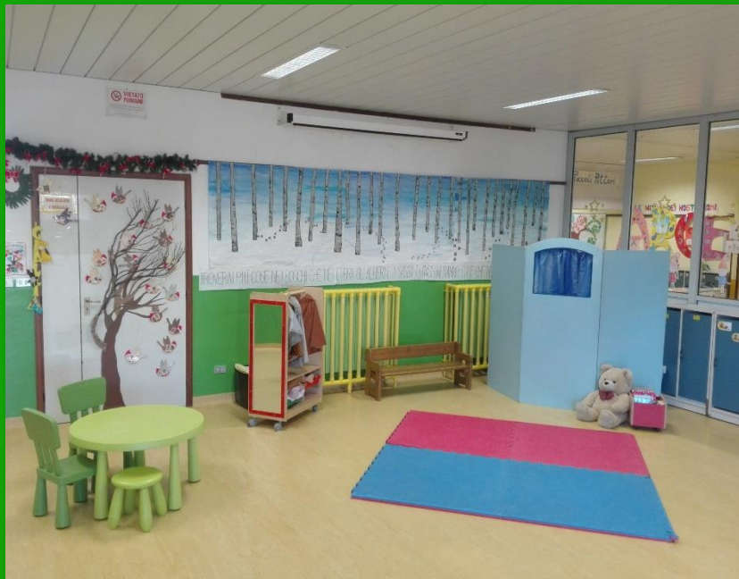
il salone d'ingresso

La scuola dell'infanzia, immersa in un'area verde attrezzata, si sviluppa su di un unico piano ed è composta da :