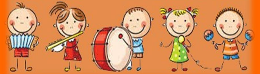
Angolo ludico - musicale