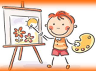
Angolo pittorico espressivo