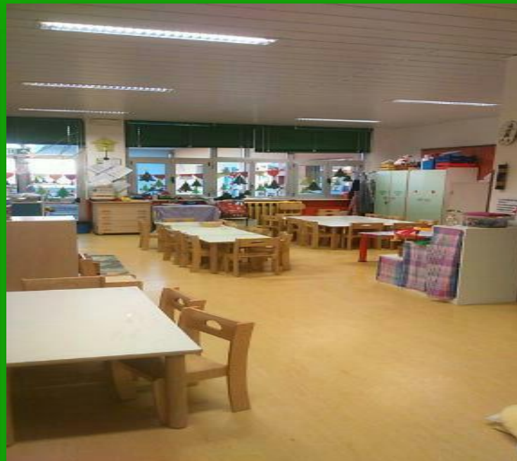
n. 6 aule -sezioni con i servizi igienici all'interno e con accesso diretto al giardino