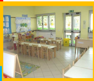
n. 2 refettori

n.6 aule adibite a sezioni (esempio di sezione)