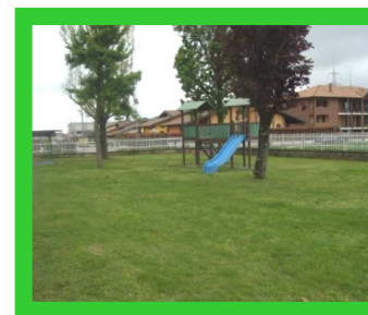
Un bellissimo giardino attrezzato