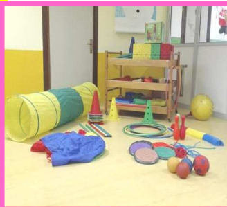
Il materiale psicomotorio