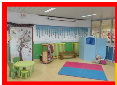
Il salone d'ingresso

n.6 aule adibite a sezioni (esempio di sezione)