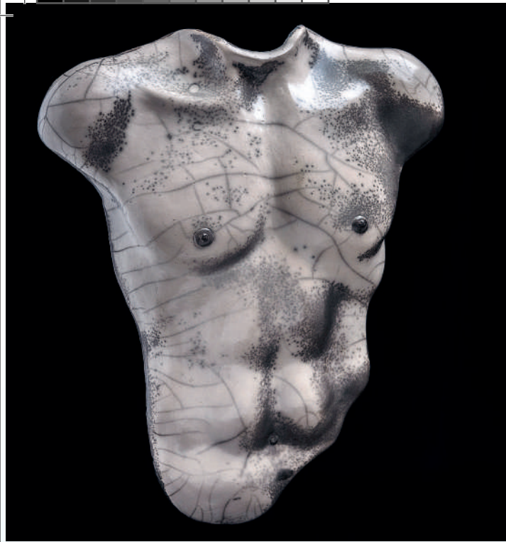
LAMPADA "ROMEO", naked raku, 56 cm