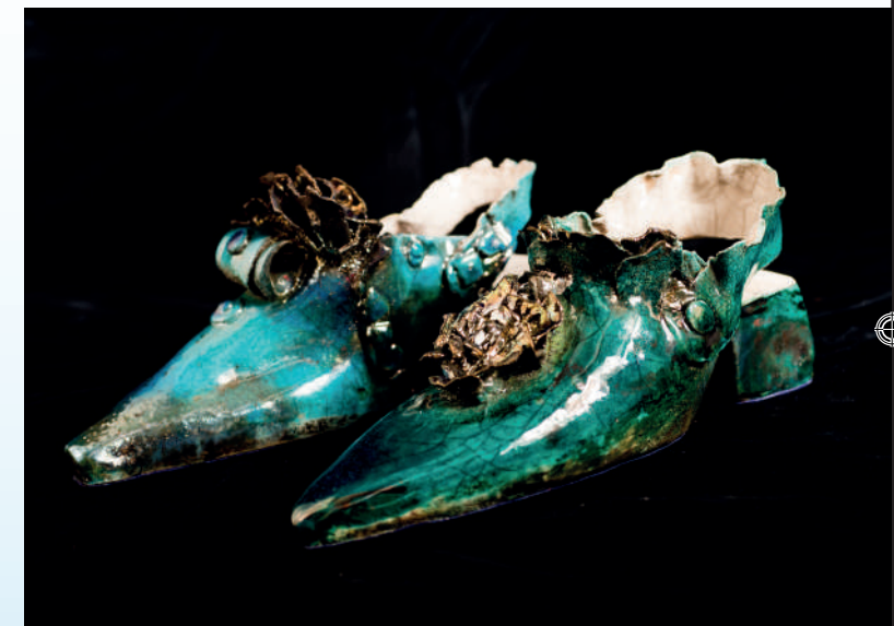
A SHOE FOR YOU PANTOUFLE, ceramica raku, 25 cm

CAMERI Sala Riunioni Circolo "G. Matteotti"