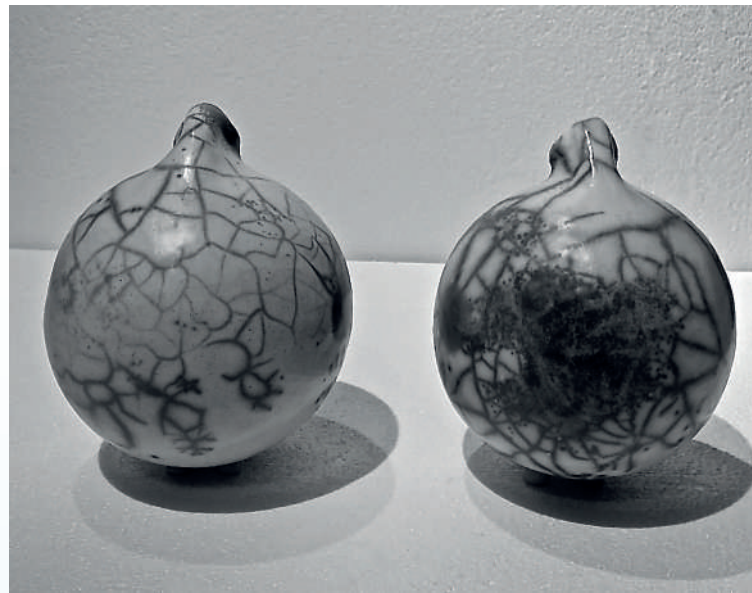
BACIO ESCHIMESE, naked raku, 16 cm