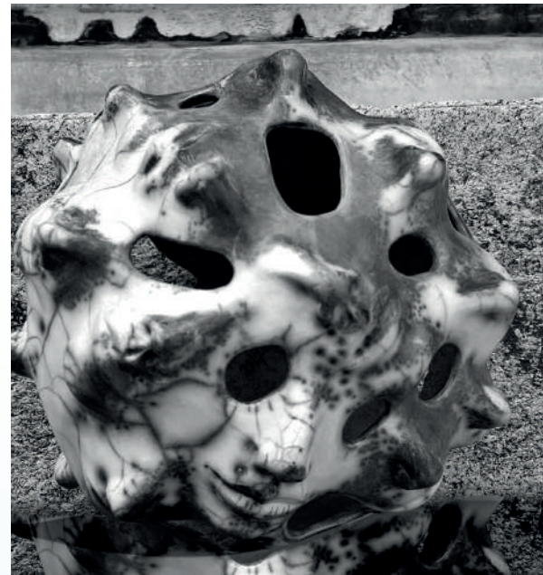
FOUGHT, naked raku, 43 cm

Contatti: www.florine-art.com ; www.florine-art.it ; florine@florine.it