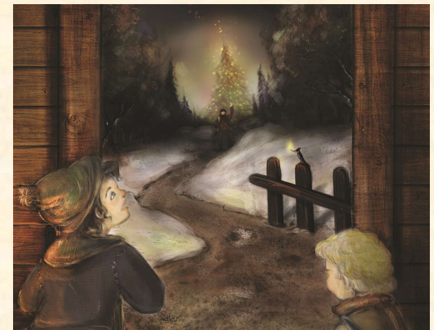
Illustrazione per Bosco di Fiabe, particolare, pittura digitale, 2015