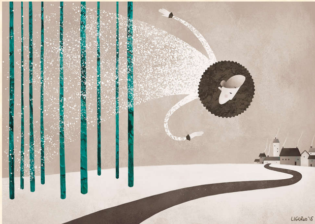
La bufera (per Bosco di Fiabe), pittura digitale, 2015