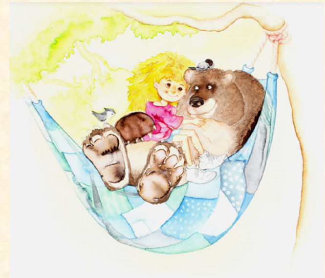
Acquerello su carta di A. Curreli