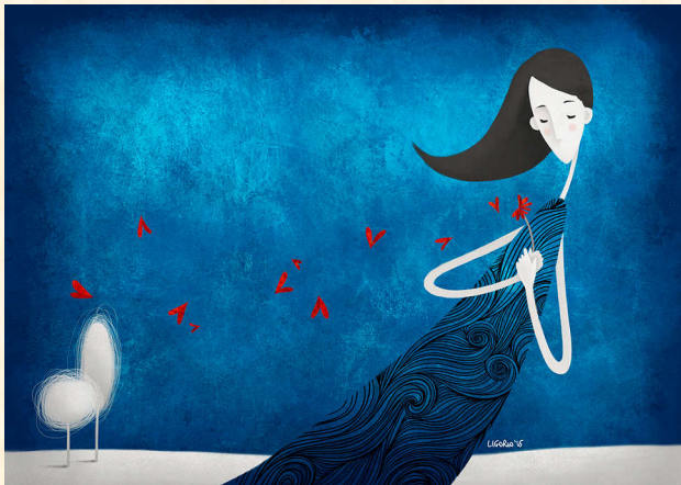
Perdere per amore, pittura digitale, 2015