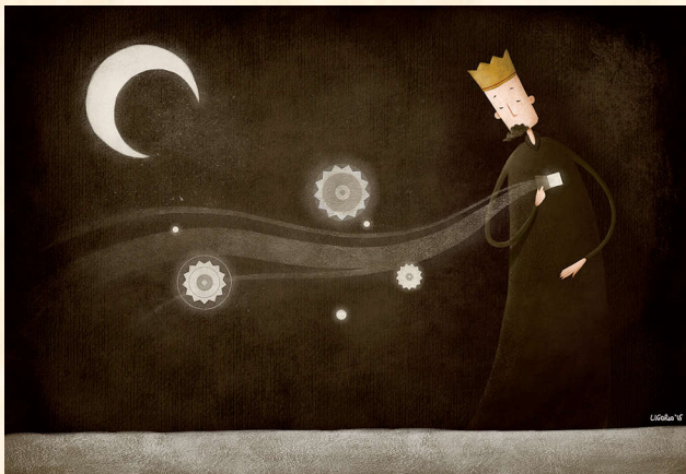
Il re delle stelle, pittura digitale, 2015