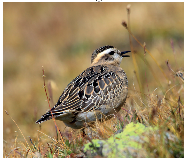
Piviere tortolino, Parco Gran Paradiso, agosto 2017

Circolo Culturale "G. Matteotti" - Circolo Culturale "A. Colli"