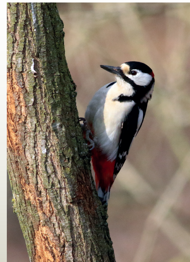
Picchio rosso maggiore, Parco Valle del Ticino, marzo 2018