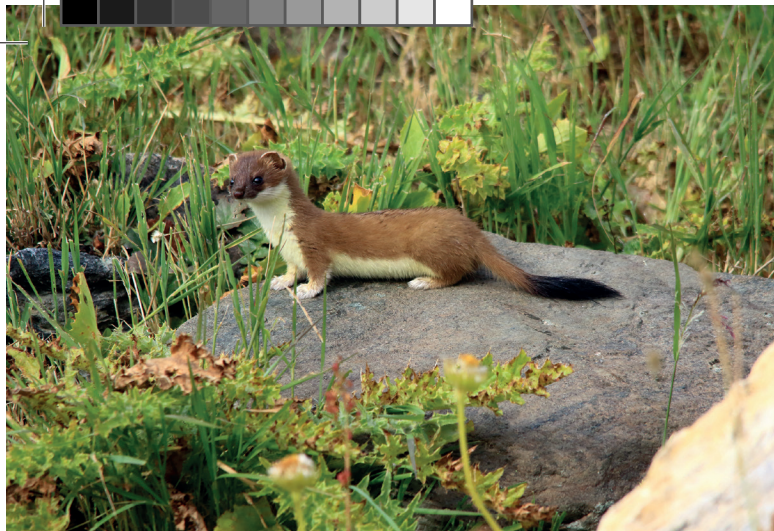
Ermellino, Parco Gran Paradiso, agosto 2017